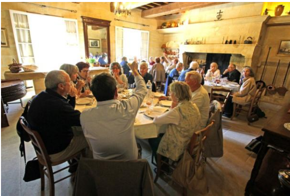
Le repas (incontournable)