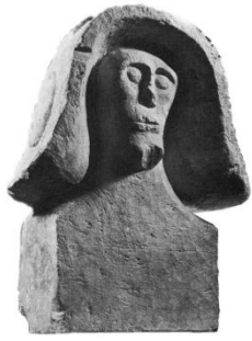
Guerrier de Ste Anastasie datant de l'âge du fer