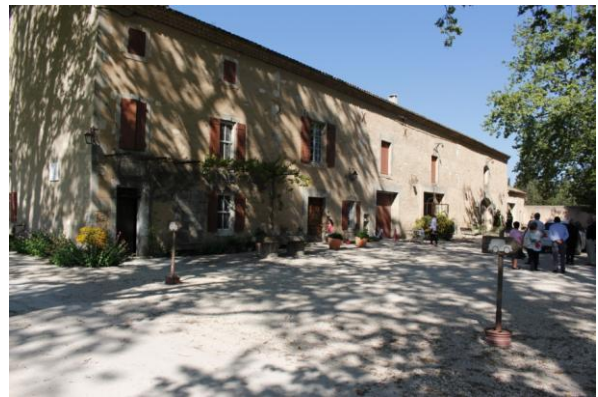
Maison de Frédéric Mistral dans laquelle il a vécu ses 25 premières années