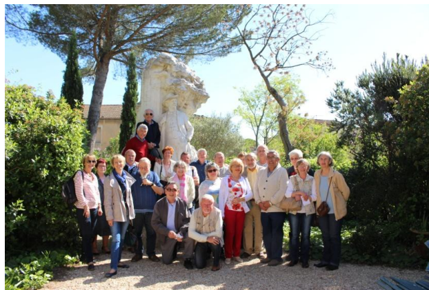
La photo de groupe