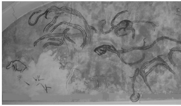
Peintures rupestres de la baume Latrone au moins aussi vieilles que celles de la grotte Chauvet.