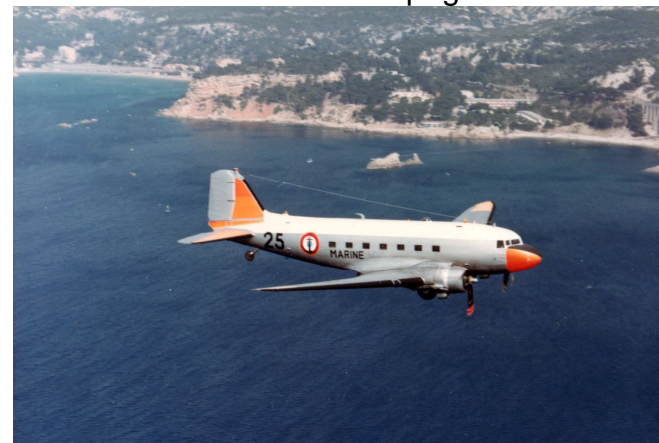
Le C47 en convoyage vers les ateliers de Cuers