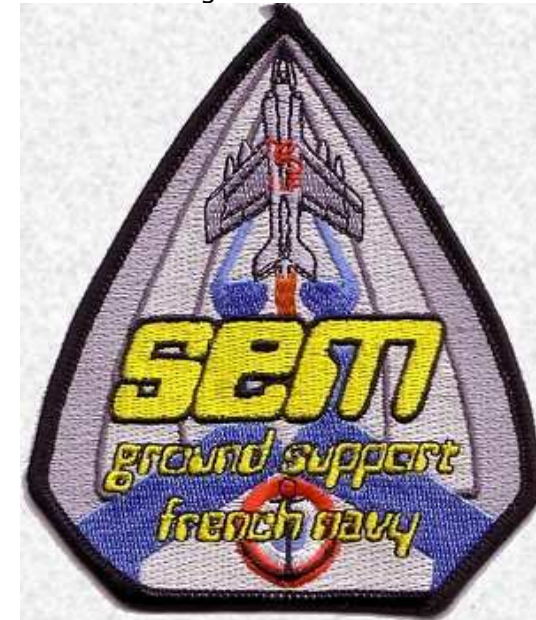
Insigne des personnels au sol de la flottille 11F

Une circulaire du 15 mars 1989 (94 DEF/CMa3) prévoit que les insignes de grade sont confectionnés par les ateliers des tailleurs de bases d'aéronautique navale. Les autres insignes (cocarde, insigne d'unité, bande nominative) sont approvisionnés dans le commerce par les bases. Les dépenses correspondantes sont supportées par le service de l'habillement, la délivrance de ces insignes au personnel volant devant se faire à titre gratuit.