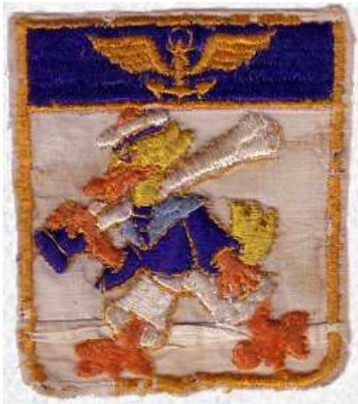
Premier modèle de l'insigne de la flottille 12F. Porté sur une combinaison de vol, il a malheureusement été lavé avec celle-ci, ce qui explique son état général

Au début des années 1950, toujours à l'imitation de leurs homologues américains, les personnels volants de l'aéronautique navale commencent à porter l'écusson en tissu de leur unité sur les vêtements de vol. Les pilotes de chasse et plus particulièrement ceux de la flottille 12F passent pour être les premiers à avoir porté ainsi l'insigne de leur formation dès 1952.