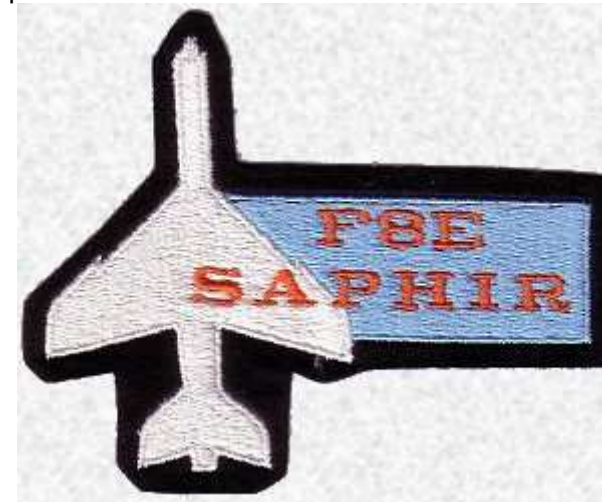
F 8 E FN Crusader. Ce dernier modèle a été produit à l'occasion de la mission Saphir pour l'indépendance du territoire français des Afars et des Issas en 1977.

Dans certaines occasions le motif symbolique de l'unité peut subir quelques modifications et présenter un caractère un peu moins réglementaire et un peu plus humoristique. Les missions effectuées sont aussi l'occasion d'arborer des insignes spécifiques. Enfin les aéronefs font également l'objet d'écussons particuliers que l'on trouve parfois cousus sur les combinaisons et blousons de vol.