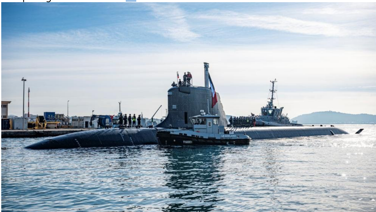
Le SNA Tourville (S637)