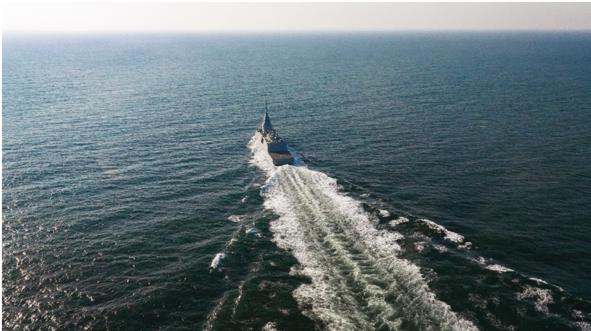
La HS Kimon

Lors d'une rencontre diplomatique à Athènes, les ministres de la Défense grec et français ont annoncé l'accélération du renouvellement de leur alliance stratégique . A cette occasion, Catherine Vautrin, ministre des Armées et des Anciens combattants, s'est rendue sur la base navale de Salamine pour visiter la frégate de défense et d'intervention Kimon , livrée à la marine grecque le 18 décembre. Cet accord, qui comprend une clause d'assistance militaire mutuelle, marque une nouvelle étape du partenariat franco-grec et contribue au renforcement de la sécurité et de la stabilité maritime de la Méditerranée.