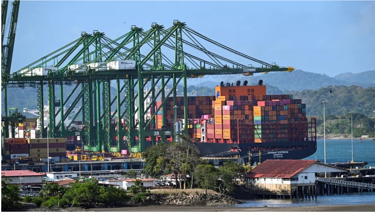
Le port de Balboa