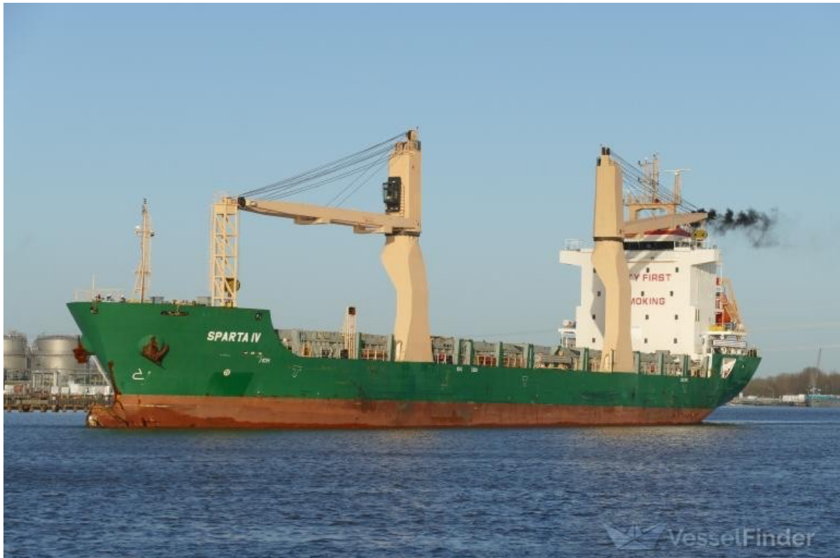
Le Sparta IV

Le 25 février, le cargo se trouvait près du Danemark avant de rejoindre le port de Kaliningrad, où il est attendu en fin de semaine.