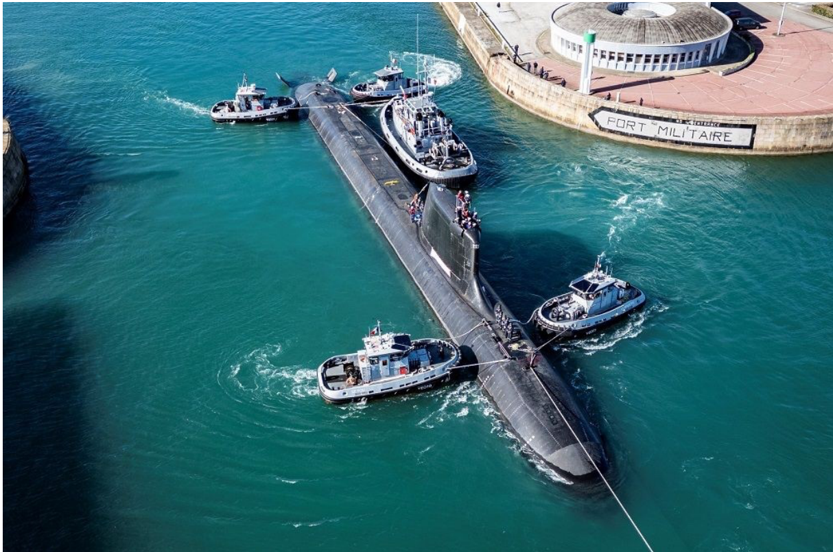
Le sous-marin nucléaire d'attaque De Grasse à Cherbourg

La livraison du De Grasse à la Marine nationale est prévue courant 2026 selon le calendrier initial, pour une entrée au service actif à l'horizon 2027. Les deux futurs sous-marins du programme, Rubis et Casabianca , sont actuellement en construction, avec une livraison attendue avant 2030