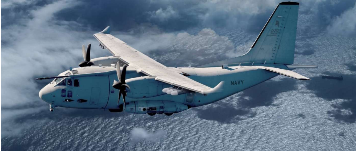
Le C-27 J Spartan en configuration MPA

Le groupe italien Leonardo, spécialisé dans l'aéronautique de défense, a confirmé le 16 février la vente de quatre avions C-27J MPA à l'Arabie saoudite, afin de doter ses forces armées d'une capacité opérationnelle inédite. Ces appareils de patrouille maritime offrent des capacités accrues face aux menaces sous-marines et de surface, tout en étant adaptés aux missions de recherche, de sauvetage et de transport. Les livraisons devraient intervenir à l'horizon 2029, selon Opex360 .