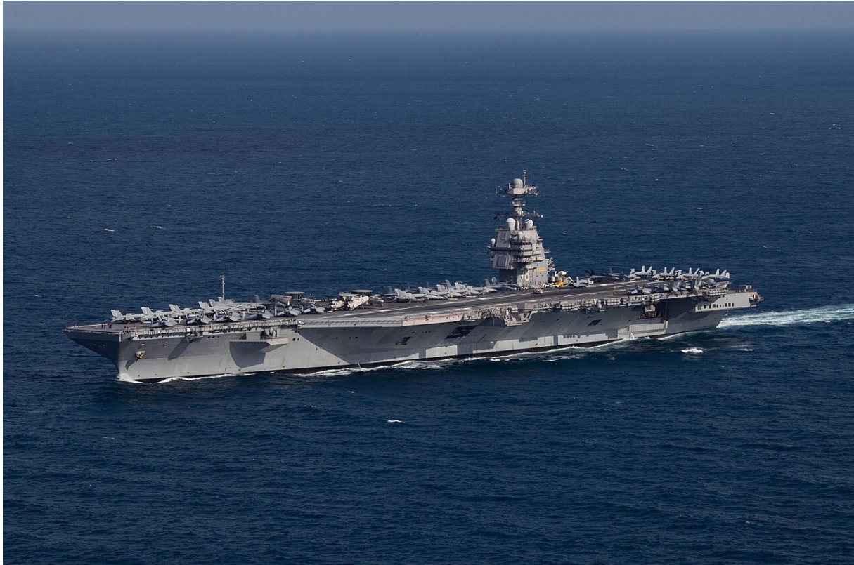
Le porte-avions USS Gerald R. Ford