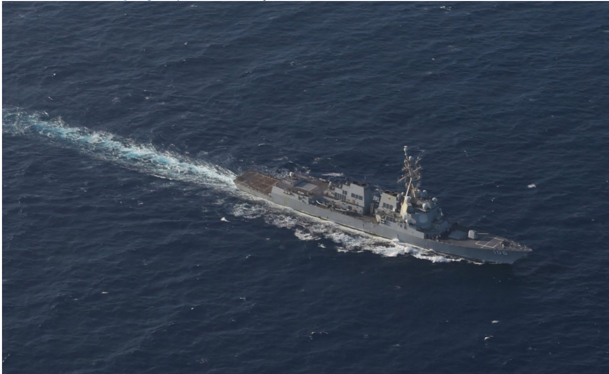
L'USS Stockdale dans les Caraïbes

Le destroyer USS Stockdale a intercepté un pétrolier russe , soumis aux sanctions européennes et britanniques, afin de l'empêcher d'effectuer sa livraison de carburant à proximité du Venezuela. Le navire russe Seahorse , contraint de modifier sa trajectoire, a néanmoins tenté à deux reprises de s'approcher des côtes avant de finalement atteindre le port de Puerto José ce 23 novembre. La surveillance américaine s'est par ailleurs nettement intensifiée ces dernières semaines dans la zone, au point que les Caraïbes concentrent désormais près d' un quart des navires actuellement déployés par l'US Navy.