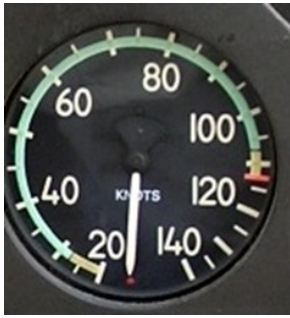
Badin Alouette III