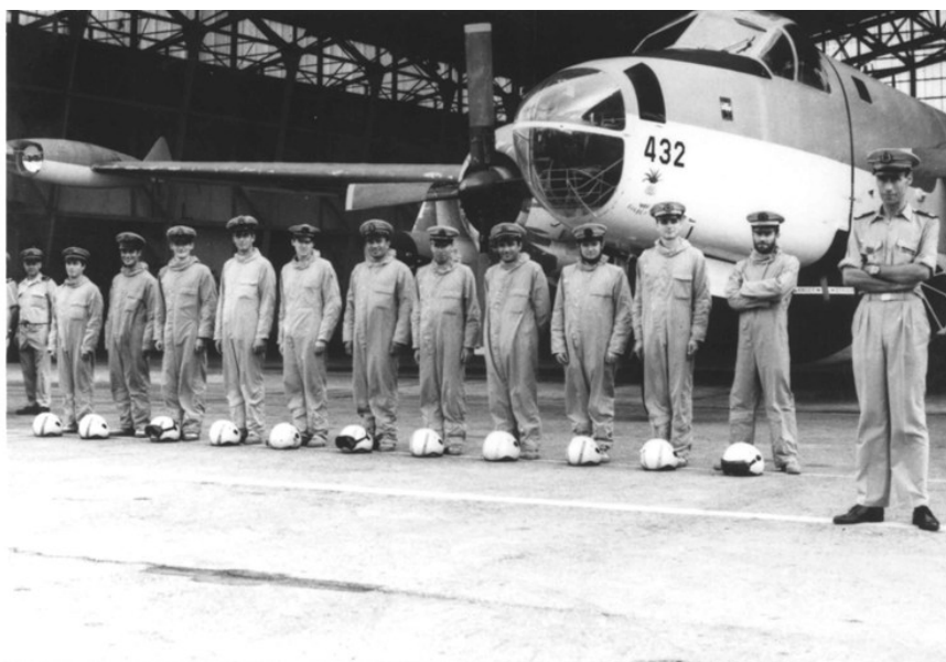
Le CC Piquet commandant la 23F et l'équipage du LV Troadec en 1970