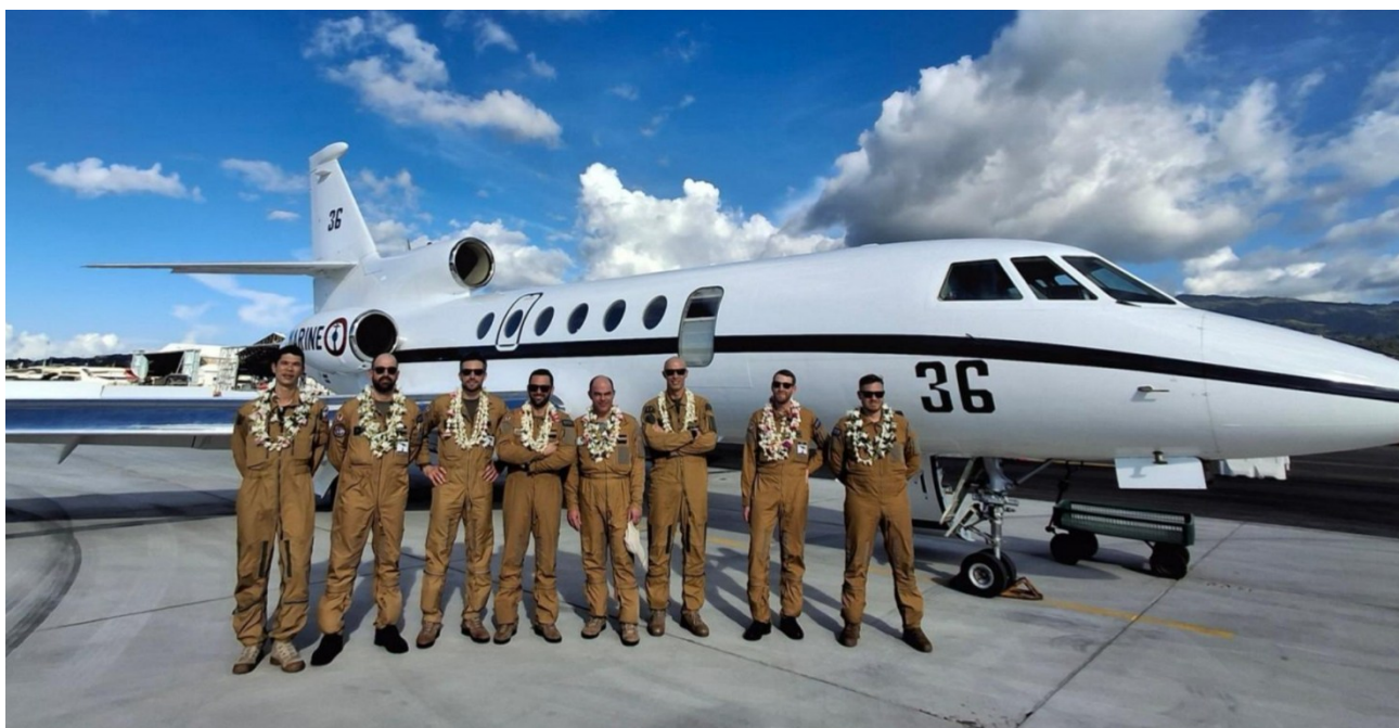
L'équipage du Falcon 50 Marine n°36 qui vient de rejoindre la flottille 25F basée à Tahiti Faa'a.