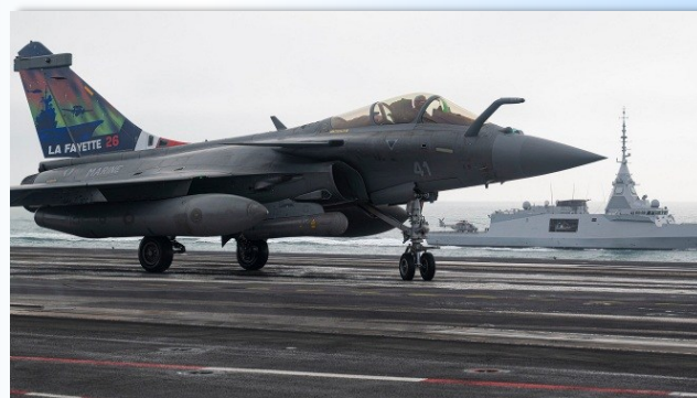
Un Rafale Marine aux couleurs de l'exercice La Fayette 26.

Le PA CDG est arrivé le 25 février dans le port suédois de Malmö pour y faire escale quelques jours, une première selon le ministère suédois de la Défense. Le groupe aéronaval doit participer à la mission Baltic Sentry en mer Baltique, destinée à dissuader les menaces contre les infrastructures sous-marines que Moscou est soupçonné d'avoir perpétrées.