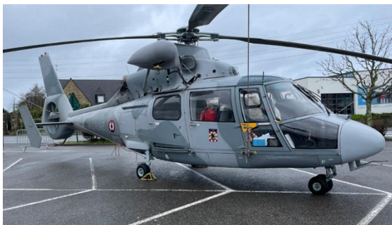
Dauphin N3 de la flottille 34F

Les pilotes d'hélicoptères qui ne représentaient par le passé que 20% des pilotes de l'Aéronavale sont actuellement près de 40%, soit pour la dernière année 15 pilotes d'hélico pour 8 chasseurs et 12 patmar.