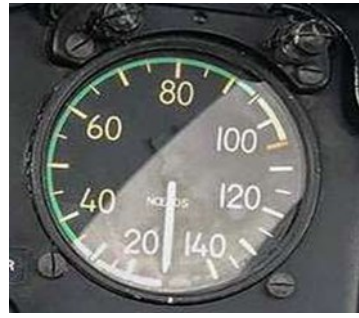
Badin Alouette II