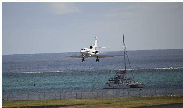
Le Falcon 50 Marine n°36 en courte finale à Faa'a.

D'ici 2027, un troisième Falcon 50 viendra compléter la flottille, consolidant ainsi les capacités des forces armées dans les domaines de la sécurité maritime, de la protection de l'environnement marin et de la coopération régionale.