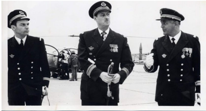
LV Huissoud, CV de Gaulle, CF de Poilloüe de Saint Mars