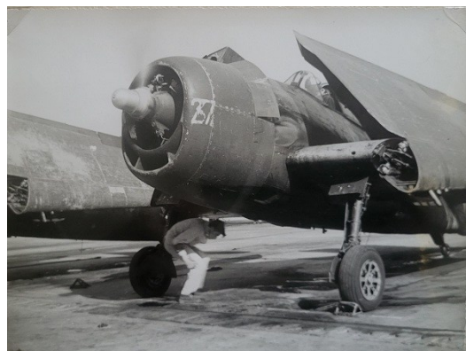
F6F-5 « Paré à rouler » Le mécano enlève les cales.