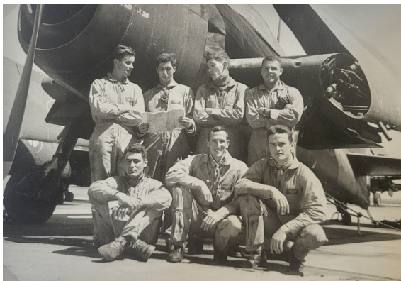
La promo d'application chasse - Mars 1960.