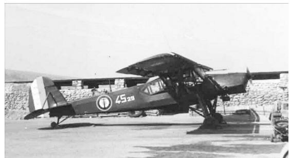
Un MS-500 Marine de la 4S.

L'histoire de la Section Morane 500 de la DBFM est l'objet d'un excellent Cahier de l'ARDHAN, n'hésitez pas à vous le procurer.