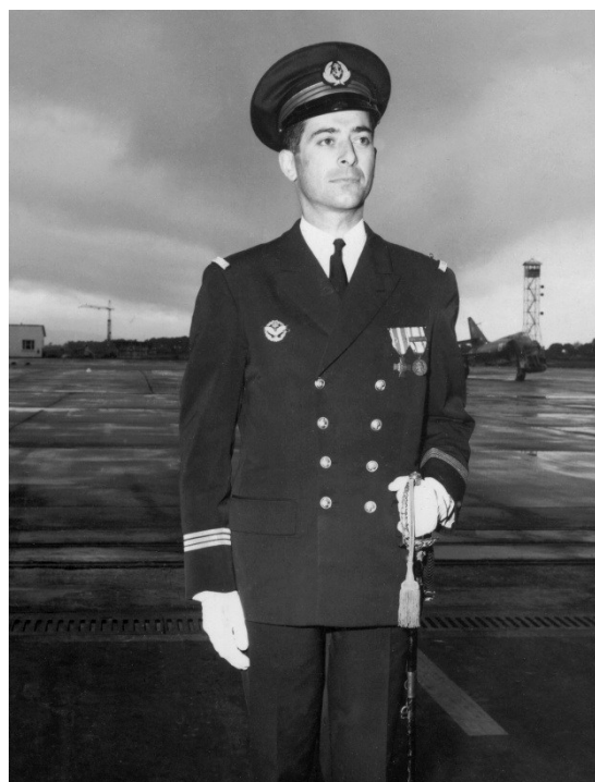
Le LV de Vivie prenant le commandement de la 17F le 6 avril 1966.

Distinctions : Officier de la Légion d'honneur, Commandeur de l'Ordre national du Mérite, Croix de la Valeur militaire, Médaille de l'Aéronautique.