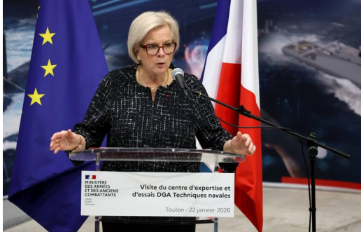
Mme Vautrin, ministre des Armées et des anciens combattants

La ministre des Armées Catherine Vautrin demande à la DGA d'accélérer les programmes d'armement pour réduire les délais entre besoins opérationnels et livraisons (Source divers Presse).