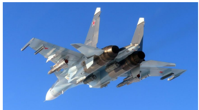
Su-30SM2 de l'aviation navale russe (MA VMF), intercepté par des EF-18 de l'Armée de l'Air espagnole.

Le détachement comprend environ 200 personnes issues d'un large éventail d'unités et de spécialités, allant des opérations aériennes à la logistique et à la protection des forces. Elle exploite une flotte de douze appareils : onze chasseurs EF-18M Hornet de l'Ala (Escadre), 15 à Saragosse et un seul avion de transport TK23 A400M de l'Escadre 31, également basée à Saragosse. Dans l'ensemble, cela représente le plus grand déploiement aérien de l'Espagne sur le flanc est de l'OTAN à ce jour.