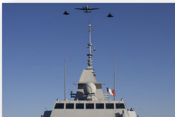
Survolant une FREMM, un ATL2 avec un Rafale dans chaque aile.