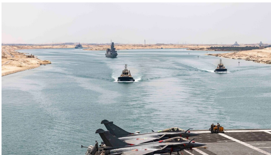
Le groupe aéronaval franchi le canal de Suez.

Suivez-nous aussi sur les réseaux sociaux