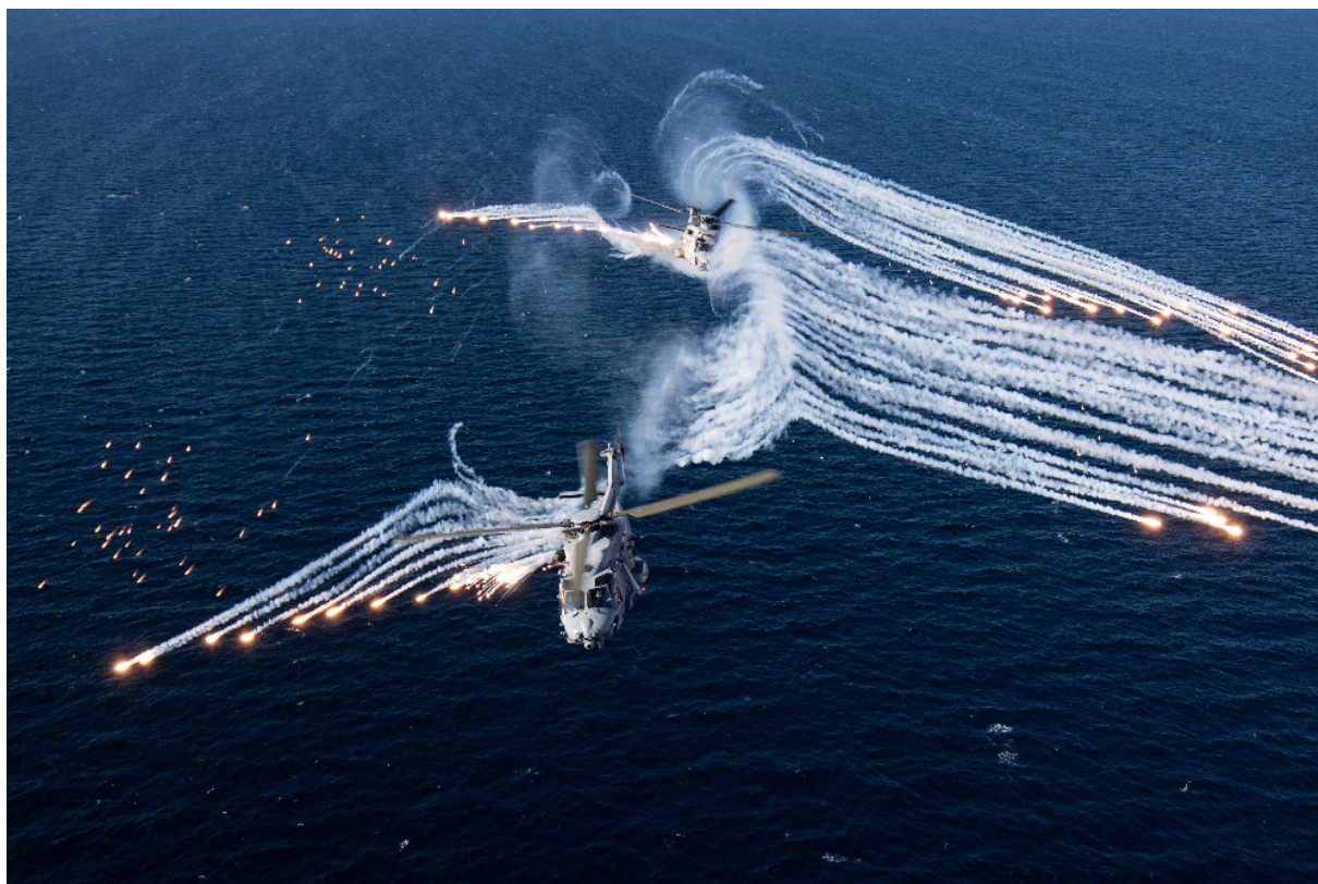
Dans le cadre du maintien en condition opérationnelle, deux Caïman Marine de la Flottille 31F effectuent un tir d'entraînement de leur composante d'armement d'autodéfense, à savoir des contremesures "leures".