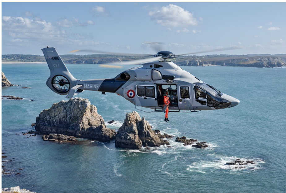
Un hélicoptère H160 de la Flottille 32F en entraînement sur la presqu'île de Crozon.

Suivez-nous aussi sur les réseaux sociaux