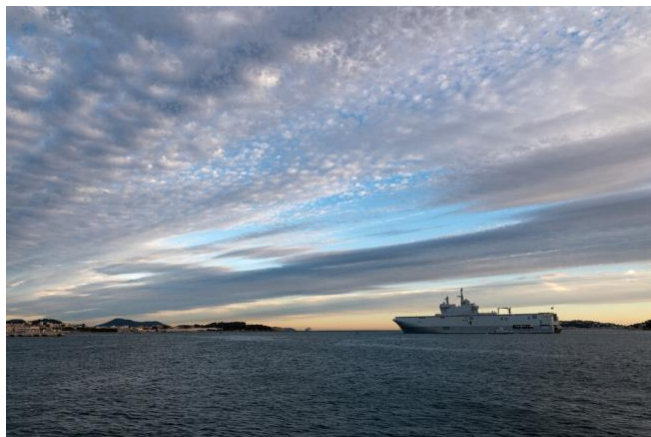
Le porte-hélicoptères amphibie Dixmude appareille de la base navale de Toulon.